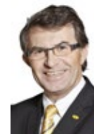
Franz Piribauer Kulturstadtrat