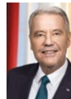
Klaus Schneeberger Bürgermeister